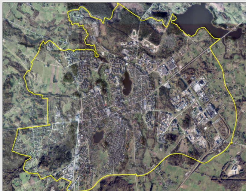
1 pav. Utenos miesto (tikslinės teritorijos) žemėlapis

Vietos plėtros strategija bus įgyvendinama Utenos mieste, kuris yra rajono savivaldybės administracinis centras ir vienas iš didžiausių Utenos apskrities regiono miestų. Bendras Utenos miesto (tikslinės teritorijos) plotas – 2245,5 ha (buvo 1528 ha), (Lietuvos Respublikos Vyriausybės 2015 m. kovo 13 d. nutarimas Nr. 242 „Dėl Utenos miesto teritorijos ribų pakeitimo“). Plotas padidėjo dėl miesto teritorijų plėtros, kai buvo praplėstos miesto teritorijos ribos.